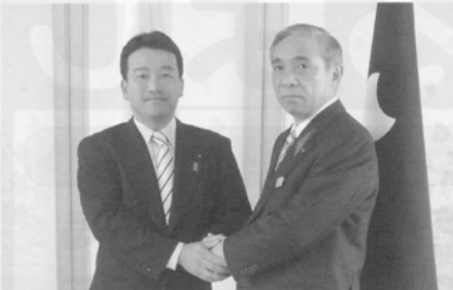
大沢正明知事と固い握手の笹川博義