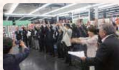
●H27.7.5/群馬県知事選挙 大沢正明太田市選挙事務所祝勝会