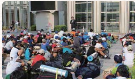
●H27.8.5 / おおた100kmアドベンチャーワーク2015