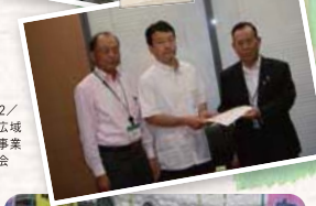
●H27.6.2 / 太田相生広域 土地改良事業推進協議会