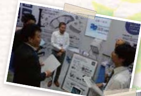
●H27.6.24 / 第26回 日本ものづくりワールド