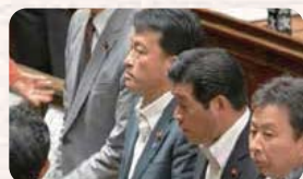
●H27.6.2 / 本会議場