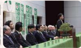
●H27.1.5 / 群馬県農協中央会・各連合会 2014年新年祝賀式