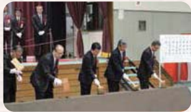
●H27.2.7 / ハッ場ダム本体建設工事起工式