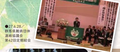
●27.6.28 / 群馬県難病団体連絡協議会 第42回定期総会