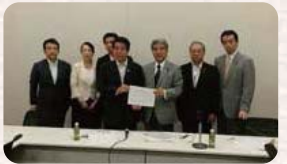
●H27.7.28 / 「上野三碑」世界記憶遺産登録推進議員連盟 設立総会