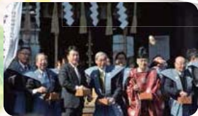
●H27.2.3 / 館林長良神社 部分祭典