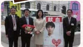
●H27.4.22 / 衆議院中庭にて春の献血