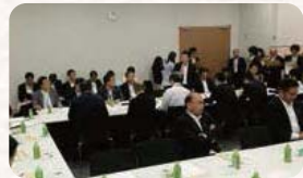
●H27.6.16 / 鳥獣食肉利活用推進議員連盟(ジェエ議連)総会