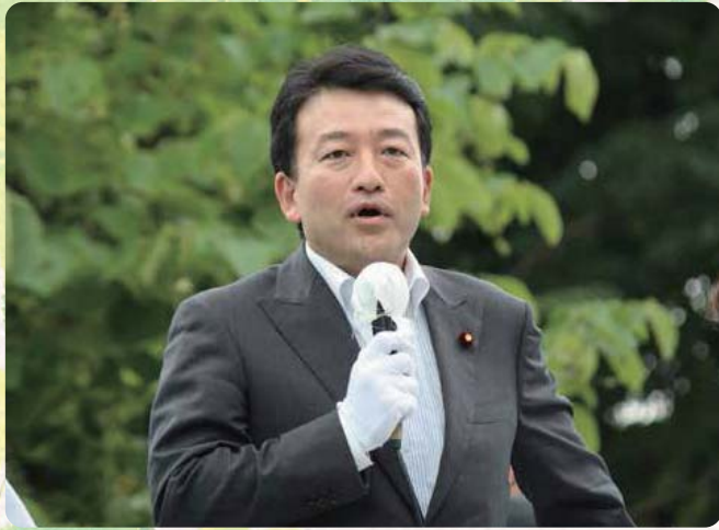
●H27.6.14 / 自民党群馬県連 青年部・青年局合同街頭行動