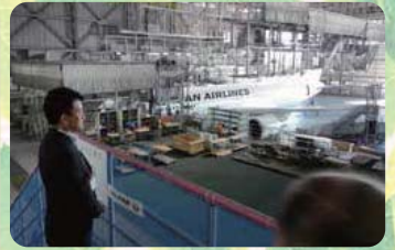
●H27.8.6 / 日本航空安全整備センター整備工場視察