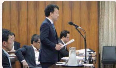
●H27.5.19 / 環境委員会(参考人質疑)