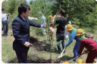
●H27.5.24 / 第59回群馬県植樹祭