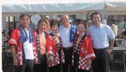
●H27.7.26 / 新田平成27年木崎祇園祭り