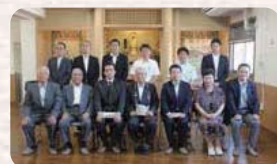
●H27.8.4 / 群馬県矯正施設・更生保護施設視察