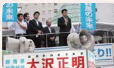
●H27.7.4/高崎地区決起大会2

地元はもとより群馬県の発展のため引き続き県政に取り組んでいただきたいと思います。