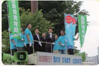
●H27.6.14 / 自民党群馬県連青年部・青年局合同街頭行動