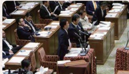
●H27.7.1 / 平和安全法制特別委員会(一般質問)