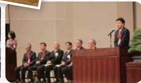
●H27.3.28 / 太田市合併10周年記念式典