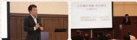
●H27.7.3/東毛議員懇話会 総会及び研修会

平成27年7月3日、太田市にて東毛議員懇話会臨時総会ならびに研修会が開催されました。一部の臨時総会では、大沢群馬県知事をはじめ太田市・館林市・邑楽郡5町の各首長、自民党6県議に来賓としてご臨席賜り、役員改選等を行いました。