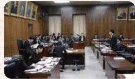
●H27.3.10 / 予算委員会分科会(経産省予算質疑)