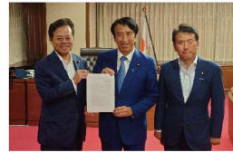
外国人労働者特別委員会「齋藤健法務大臣への申し入れ」