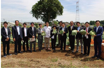
農林水産委員会での視察の様子

衆議院農林水産委員長として皆様の健康を守る農業の安心・安全そして安定に向けて「様々な価格高騰分の価格転嫁」、「種子、飼料、備蓄の強化」、「給食費の公費化(食育につながる)」、「気候変動などによる災害対応の強化」などに向けしっかり取り組んでおります。