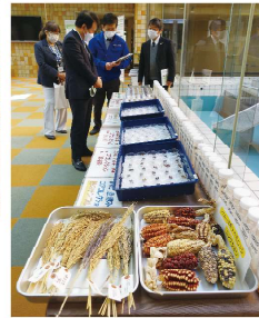
農業・食品産業技術総合研究機構視察(気候変動に対応する品種の開発)