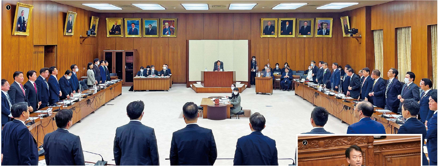
① 農林水産委員会グリーンウッド法採決 ② 衆議院本会議・農水委員長報告にて