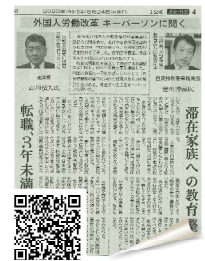
R5年5月24日 日経新聞 4面より