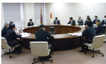
関係首長・県議とともに 山本一太郎群馬県知事へ要望