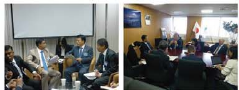
●インドネシア環境林業省ダワンティラ上席顧問 ●国際連合環境計画(UNEP)E-ソールハイム事務局長

地球温暖化が進み、これまで経験したことのない近年の猛暑や異常気象は気候変動の影響である可能性が指摘されています。この状況を踏まえて、低炭素社会の構築に向け様々な取り組みを行っています。CO 2 排出削減のためには、国・地方公共団体・民間等が一体となった取り組みが必要となります。