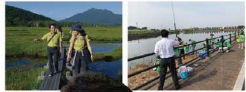
●尾瀬視察 ●中野沼「平成30年度外米産取捨大作戦」