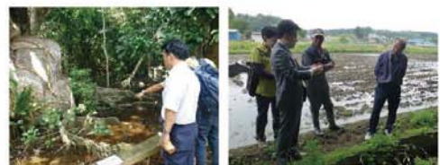
●世界自然遺産候補地視察・沖縄北部及び西表島 ●ニヤコナゴ生態地保護区

私たちは、経済発展・暮らしの利便性の向上のために、様々な生物の暮らし豊かな自然を失ってきました。自然破壊を食い止め、保護・管理することで後の世代に自然の恵みを残すために、「優れた自然風景地を保護すること」、「野生生物の保護・管理」、「鳥獣被害への取り組み」などに取り組んでいます。