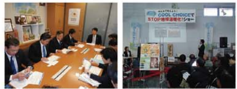
●群馬県議団水産勉強会 ●アールナイス太田市 試食会＆トークショー