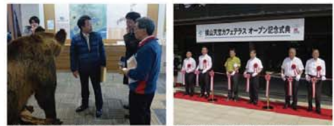
●支那河豚国立公園・産卵視察 ●伊勢志摩国立公園横山ビジターセンター