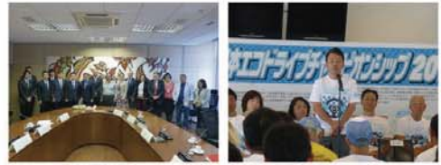
●東京のG20日本開催に向けてブラジル、バグダッドへ ●日本エコドライブチャンピオンシップ2018