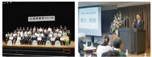
●低炭素村2018表彰式 ●熊本 森童川大対大をしのびのシンポジウム