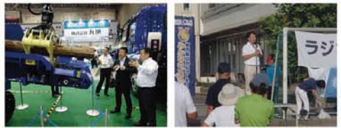
●第27期 2018NEW環境展・第10回地球温暖化防止展 ●明和町 都市鉱山から作るみんなのメダル

現在でも、一般廃棄物が年間4,500t以上、産業廃棄物が年間40,000t近く発生しており、廃棄物の適正処理および排出量を抑制することは、環境省の重要な役割です。「循環型社会」の実現のため、廃棄物の発生抑制(リデュース)・再利用(リユース)・再生利用(リサイクル)、すなわち3Rを進めるため様々な取り組みをしています。