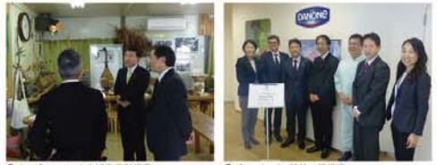
●サンデンファレスト赤城事業所視察 ●ドンジャンバシ 産林工場視察