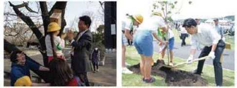
●鳥獣保護議員懇話会「憲政記念館の東鳥突け」 ●第72回群馬県植樹祭