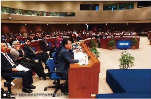
一 環境問題への取り組みについて お聞かせください

温室効果ガスによる地球温暖化やエネルギー問題など、環境問題は我が国のみならず地球規模で考えなければなりません。気候変動に対しては、温暖化対策の国際枠組みである「パリ協定」のもと、我が国でも温室効果ガスの排出削減目標を達成すべく取り組んできました。経済規模で見れば日本は世界第3位であり、やはりその規模に見合った責任と貢献を果たしていくべきでしょう。 同時に、既に進んでしまった温暖化に対処・適応するため、「気候変動適応法」を今国会に提出しました。気温の上昇は、自然災害の増加や農作物の品質低下など、さまざまな影響を引き起こします。この適応法は、温暖化に関わるデータを集約して自治体などに提供し、防災対策や農作物の品種開発といった適応策を推進するものです。データを分析・調査する