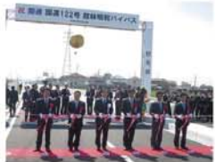
●国道122号 龍林町とイバシ間通式

などドクターヘリの運用課題が大きく改善され、大規模災害時には自衛隊の大型ヘリや複数のドクターヘリの離着陸も可能になりました。私は群馬県議会議員時代から、このドクターヘリの課題に取り組んできました。新病院の完成は県にとって非常に喜ばしい出来事であり、関係者の皆様に心より感謝申し上げます。そのほか、東毛広域幹線道路を活用した県内経済の活性化や、2028年に群馬県で開催予定の国民体育大会に向けた運動設備の充実など、さまざまな課題に対して貢献するため力を尽くします。