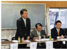
●群馬県法政大学等検討PT「現地視察意見交換会」

一 経済成長の中でどのように自然環境を守っていけばよいのでしょうか 一昔前までは、経済発展と自然環境の保全とは、相反するものだと考えられていました。しかし現在では大きく価値観が変わり、経済成長と環境保全をまさに車の両輪として進める時代になりました。世界