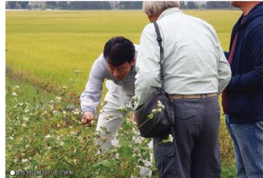
●群馬県産品のPR活動