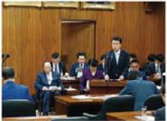
●環境委員会にて答弁

一 国内では外来種の問題も話題ですね。昨年末にテレビ東京の人気番組「池の水ぜんぶ抜く大作戦」の収録に参加させていただき、草加市の「そうか公園修景池」のかいばりを行いました。お正月に放送されたので、ご覧になった方も多いかもしれませんね。身近なテレビ番組を通して、自然環境や外来生物について一人でも多くの方が関心を持ってくだされば、とても嬉しく思います。 昨年大きな話題になったヒアリの問題も、夏に向けて再び警戒が必要です。外来種の侵入は、物流網の国際化と切り離して考えることはできません。経済活動を重視しつつも、目を向けていかなければならぬ課題といえるでしょう。